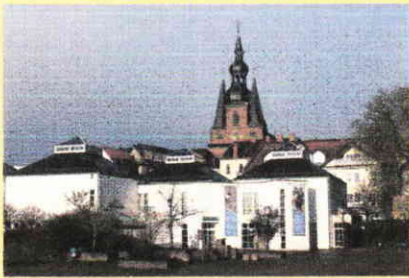
Mia-Münster-Haus, St. Wendel